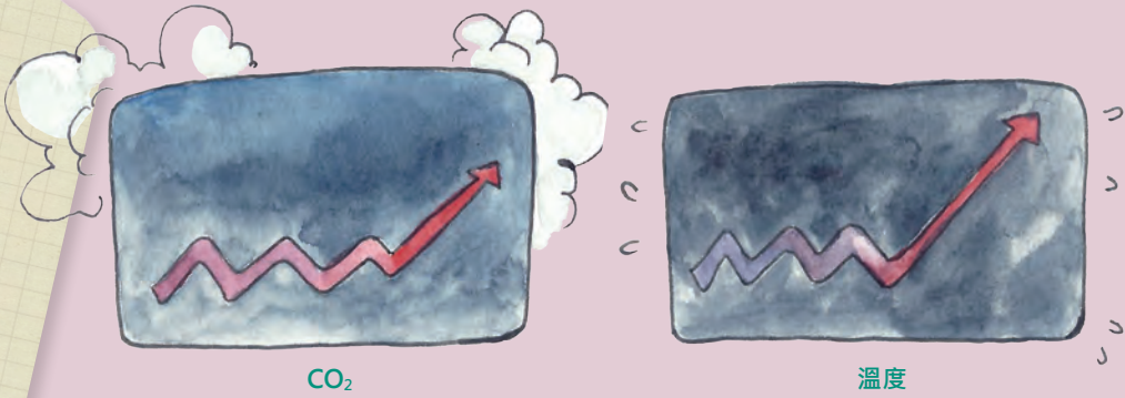
■ 二氧化碳濃度與地球溫度圖