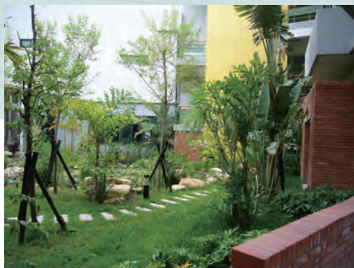
高雄市前鎮區紅毛港國小二期校舍新建工程：生態池邊廣植多樣化之誘鳥誘蝶誘蟲植栽。

曾經被稱為「福爾摩沙」的臺灣，在千萬年前即是萬物生活的天堂，繁盛的各式物種居住在臺灣的水岸、原野、叢林、高山中，是一幅生態永續的景象。今日，為了讓人類居住需求與生物生存需要得到均衡，綠建築特別強調大型建築開發案（面積大於一公頃）需要兼具「生物多樣性」觀念。在建築物建築規劃上，儘可能地在基地上種植可以開花結果、供生物採集花蜜與果實、種類繁盛的植物；降低大面積空地、廣場或停車場影響生物的棲息與移動環境，並適當地留設生物生存所需之廊道；同時儘量避免照明光害影響夜行性生物之活動。如此，綠建築便能讓人類與許多生物並存，讓環境保有更大的生物多樣性。