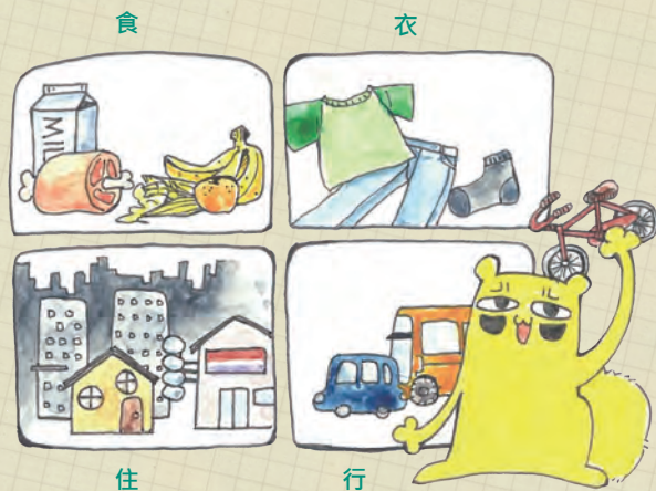
■ 食衣住行的減碳策略

因為全球氣候變遷的影響，強颱、強降雨、乾旱等極端氣候現象越來越常見！為了盡一份地球公民的責任，每一個人必須在生活上儘量符合低碳環保理念。例如，在「食」的方面，以在地食材、當令蔬食、愛惜食物、減少使用免洗餐具為原則；「衣」的方面，以使用天然衣料、無毒洗潔、減少乾洗為基礎；「住」的方面，採用綠建材、優先選購綠建築、使用節能標章家電、採用省水標章器具為要項；「行」的方面，以步行或自行車代步、降低汽機車使用頻率、選購環保標章汽機車為目標。如此，便能有效降低個人的碳排放量、減少廢棄物及污染排放、減緩對環境的衝擊，並讓生活更符合永續的理想。