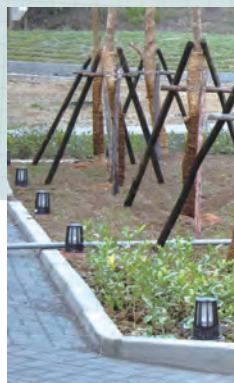
工研院六甲院區二期宿舍：戶外照明有遮光罩避免形成炫光，影響夜行生物活動。