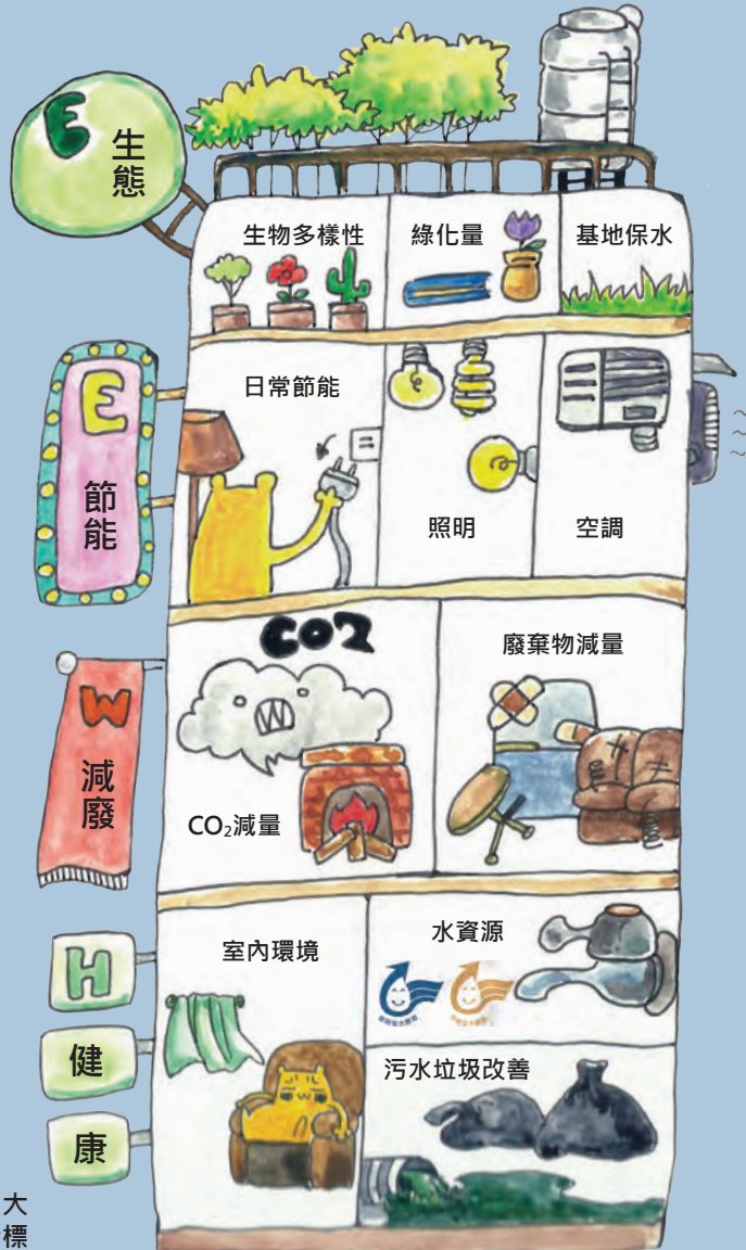
■ 綠建築標章四大範疇與九大指標