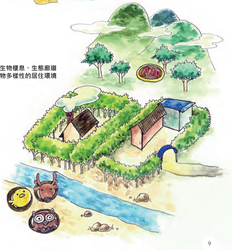
■ 兼具生物棲息、生態廊道 與植物多樣性的居住環境